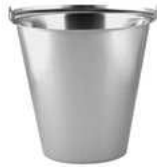
Wiadro; 18/10 Bucket; 18/10