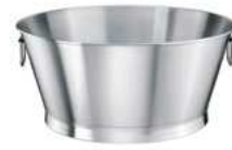
Wanna z pierścieniem; 18/10 Basin with foot; 18/10

Grubość ścianki 0,7 mm • Maksymalne obciążenie do 50 kg Steel thickness 0,7 mm • Max. load 50 kg