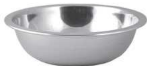
Misa; 18/10 Bowl; 18/10

Zaokrąglony rant zapewnia komfort pracy • Płaskie dno Open rolled rim for comfortable work • Flat bottom