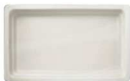
białe / white