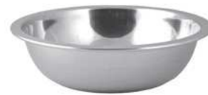
Misa z wygiętym rantem; 18/10 Rolled edge bowl; 18/10