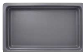
szary mat / matte grey