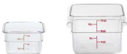
Pojemnik magazynowy; PP Storage container; PP