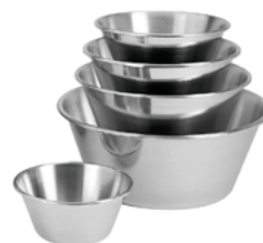
Misa z wygiętym rantem; 18/10 Rolled edge bowl; 18/10