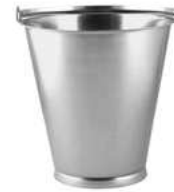
Wiadro z pierścieniem; 18/10 Bucket with foot; 18/10

Podziałka litrów wewnątrz Interior liter graduations