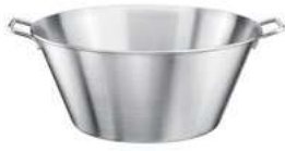
Wanna okrągła; 18/10 Basin; 18/10