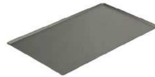
Blacha GN 1/1; Al, non-stick Sheet GN 1/1; Al, non-stick