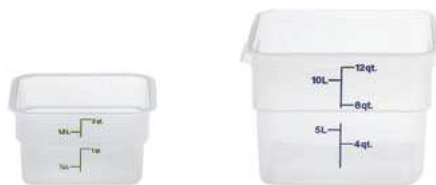
Pojemnik magazynowy; PP Storage container; PP