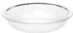
Miska; PC Bowl; PC