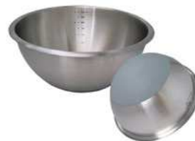
Misa do miksowania; 18/10, silikon Mixing bowl; 18/10, silicone