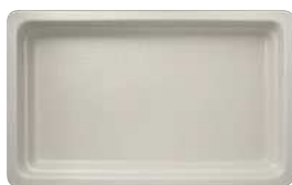
biały mat / matte white