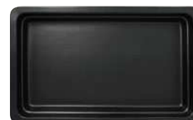
czarny mat / matte black