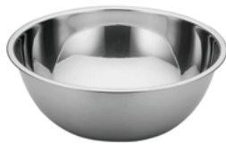
Misa z wygiętym rantem; 18/10 Rolled edge bowl; 18/10