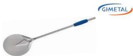
Łopata do obracania pizzy Gi Metal Azzurra 18/10 Turning pizza peel Gi Metal Azzurra; 18/10

Durable, specially balanced • Strong, oval tubular design of the handle • Riveted blade connection does not carry vibration on the handle