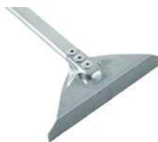
Skrobak do pieca; 18/10 Oven scraper; 18/10