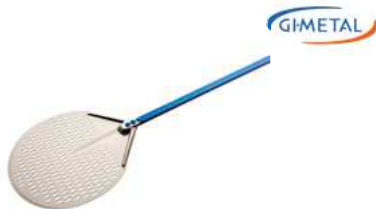
Łopata do pizzy Gi Metal Azzurra; anodowane Al Pizza peel Gi Metal Azzurra; anodized Al.

Durable, specially balanced • Strong, oval tubular design of the handle • Riveted blade connection does not carry vibration on the handle