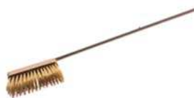
Szczotka do pieca; mosiądz, stal, drewno Brush for oven; brass, steel, wood