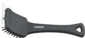
Szczotka do pieca; PP, stal Oven brush; PP, steel