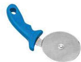
Radełko; 18/10, PP Pizza cutter; 18/10, PP