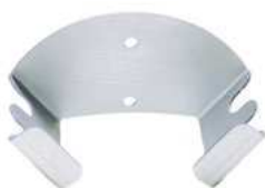
Wieszak na łopaty; Al Hanger for peels; Al.