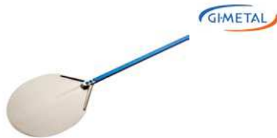
Łopata do pizzy; anodowane Al. Pizza shovel; Al.