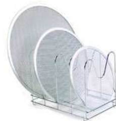
Stojak na siatki; 18/10 Pizza screen holder; 18/10