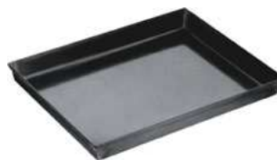
Blacha do pizzy; stal niebieska Pizza tray; blue steel