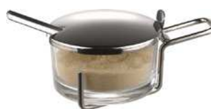
Pojemnik do parmezanu; 18/10, szkło Parmesan dispenser; 18/10, glass