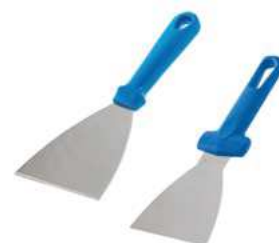
Szpachelka; 18/10, PP Spatula; 18/10, PP