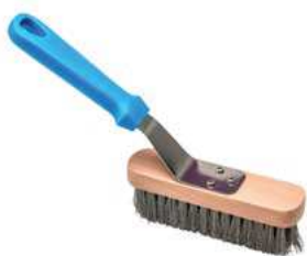
Szczotka do pieca; stal, drewno, PP Brush for oven; steel, PP