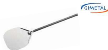
Łopata do pizzy Gi Metal Aurora; anodowane Al Pizza peel Gi Metal Aurora; anodized Al.