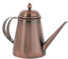
Oliwiarka; 18/10 z powłoką mosiądzu Olive oil can; 18/10 brass coated