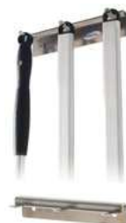
Wieszak na łopaty; Al Hanger for peels; Al.

Miejsce na dwie łopaty A place for two peels