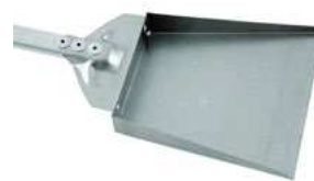
Łopata do pieca; 18/10 Shovel for oven; 18/10