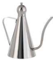
Oliwiarka; 18/10 Olive oil can; 18/10