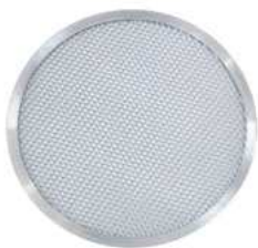
Siatka do pizzy - GI Metal; Al Pizza screen - Gi Metal; Al.