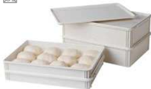
Pojemnik do ciasta na pizzę; PP Pizza dough container; PP