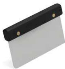
Wybierak do ciasta; 18/10 Dough scraper; 18/10