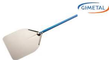
Łopata do pizzy; Al Pizza shovel; Al.

Durable, specially balanced • Strong, oval tubular design of the handle • Riveted blade connection does not carry vibration on the handle