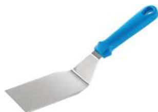
Łopatka łamana; 18/10, PP Spatula; 18/10, PP