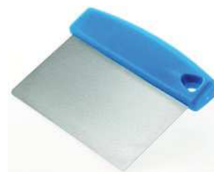
Wybierak do ciasta; 18/10, PP Dough scraper; 18/10, PP