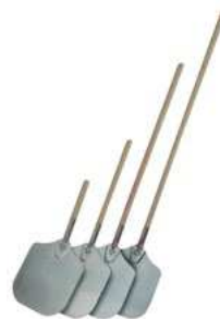
Łopata do pizzy; Al, drewno Pizza peel; Al, wood