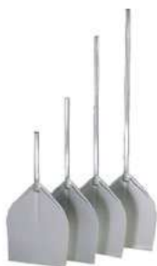
Łopata do pizzy; Al Pizza peel; Al.