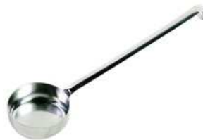
Łyżka do sosów; 18/10 Pizza ladle; 18/10