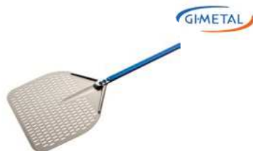
Łopata do pizzy Gi Metal Azzurra; anodowane Al Pizza peel Gi Metal Azzurra; anodized Al.

Durable, specially balanced • Strong, oval tubular design of the handle • Riveted blade connection does not carry vibration on the handle