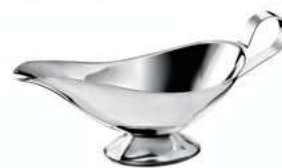
Sosjerka Sauce boat