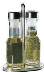
Zestaw do oliwy; 18/10 Olive set; 18/10