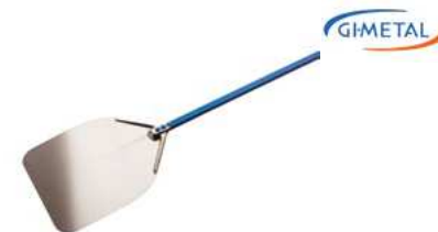
Łopata do pizzy Gi Metal Azzurra; anodowane Al Pizza peel Gi Metal Azzurra; anodized Al.

Durable, specially balanced • Perforation removes excess flour from the pizza • Strong, oval tubular design of the handle • Riveted blade connection does not carry vibration on the handle