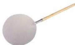
Łopata do pizzy; Al, drewno Pizza peel; Al, wood