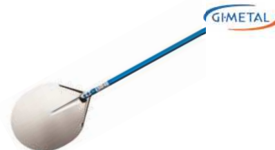
Łopata do pizzy; 18/10, Al Pizza shovel; 18/10, Al.

Durable, specially balanced • Perforation removes excess flour from the pizza • Strong, oval tubular design of the handle • Riveted blade connection does not carry vibration on the handle