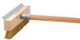
Szczotka do pieca; mosiądz, stal, drewno Brush for oven; brass, steel, wood